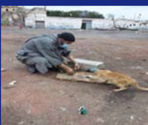
توقف ليطلع القطط لان الحجر حرمهم من الاكل

كُتبت هذه الحلقة بانفاس متلاحقة.. كنت أحاول تكديس تاريخ ألفي عام من قصة البشر مع الأوبئة في أقل من عشرين دقيقة.. ومع ذلك كان شائقاً للغاية الانتقال من عصر إلى عصر، ومن قصة إلى أخرى من أجل الإجابة على سؤال واحد: كيف تصرف البشر مع الأوبئة التي هاجمتهم في الألفي عام الماضية؟ استعد لأن تسافر معي على متن سفينة قمح تقطع أول طريق سريعة في العالم «نهر النيل» متجهة إلى القسطنطينية «اسطنبول الحالية» وتحبس أنفاسك وانت ترى البراغيت التي في أجولة القمح تنتشر الطاعون في العالم القديم.. وسترى حلم الامبراطور جستينيان بتوحيد شطري الإمبراطورية الرومانية ينهار بسبب بكتيريا..