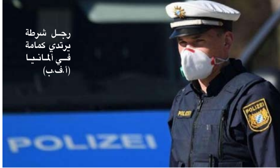
رجل شرطة يرتدي كمامة في ألمانيا

وفي بورتلاند بولاية أوريغون، تمت سرقة مئات أقنعة الوجه وسط نقص كبير في معدات الوقاية الصحية.