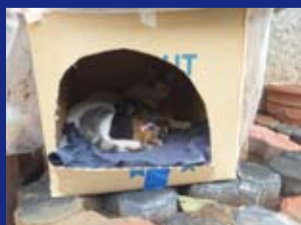
اقل ما يمكن حمايتهم من طقس الشتاء